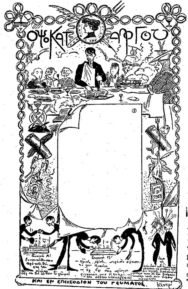
Κεντρί (Α' Βραβείον.)

εις θέσιν νά εμπνευσθοΰν και νά συνθέσουν εικόνα ιδιήν των, κατά τούς όρους τής προκηρύξεως και άφού δέν είχαν ιδέα ν, παρητήθησαν τής ιδέας. Όπωςδήποτε, αν έδίδετο πραγματικώς τό γεΰμα αυτό τής Είκοσιπενταετηρίδος μου, θα είχα νά εκλέξω μεταξύ τριών-τεσσάρων Ό- φοκαταλόγων άρχετα καλών.